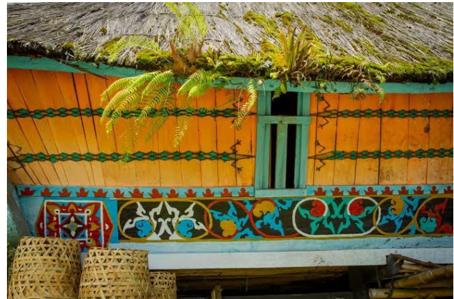
Gambar. 4. Motif Pengeret Ret

Selanjutnya, Iskandar dkk. (2022) dalam SLR mereka menyimpulkan motif-motif budaya Indonesia seperti batik, ukiran, rumah adat mengandung unsur bangun datar, simetri, dan konsep translasi geometri. Hal ini mengonfirmasi gap literatur yang kami isi: selama ini pengeret-ret belum banyak dijadikan studi kasus, sehingga hasil penelitian kami memperkaya wacana etnomatematika dengan memperkenalkan satu jenis motif baru yang teorinya valid dan kontekstual. Secara teoretis, teori pola planar oleh Adanova & Tari (2017) memberi kerangka pemahaman teknis tentang simetri translasi, klasifikasi motif ke dalam grup simetri wallpaper ( p1 , p2 , p4m , dsb.), serta domain fundamental. Hasil analisis kami menempatkan motif pengeret-ret ke dalam grup translasi-frieze tertentu, dengan domain fundamental yang bisa ditentukan secara visual atau secara digital jika dilakukan studi lanjutan. Hal ini menguatkan analisis bentuk geometris bukan sekadar deskriptif, tapi juga kuantitatif-struktural.